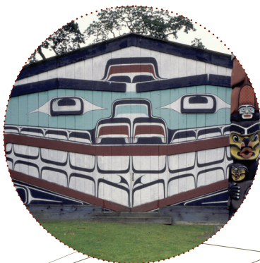
ワワディットラ／ マンゴ・マーティン・ハウス