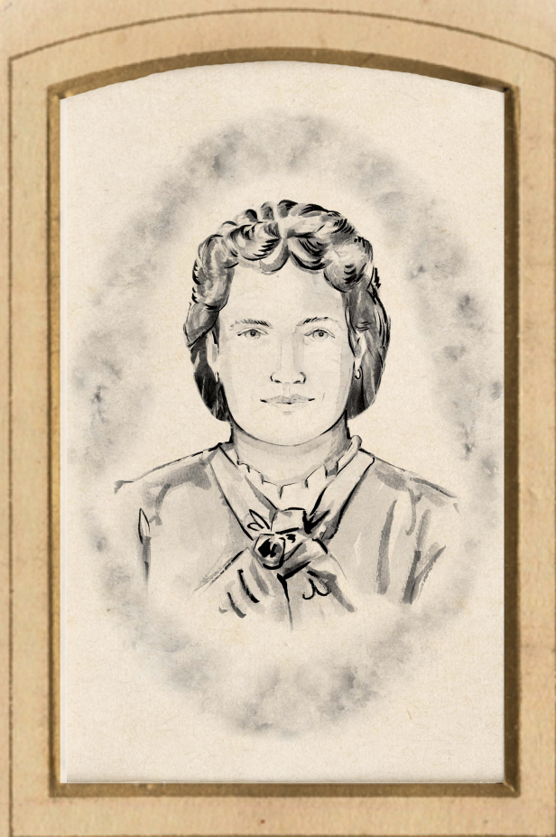
Image créée par Aimée van Drimmelen, artiste en résidence au Musée royal de la Colombie-Britannique