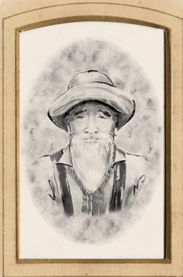
Image créée par Aimée van Drimmelen, artiste en résidence au Musée royal de la Colombie-Britannique