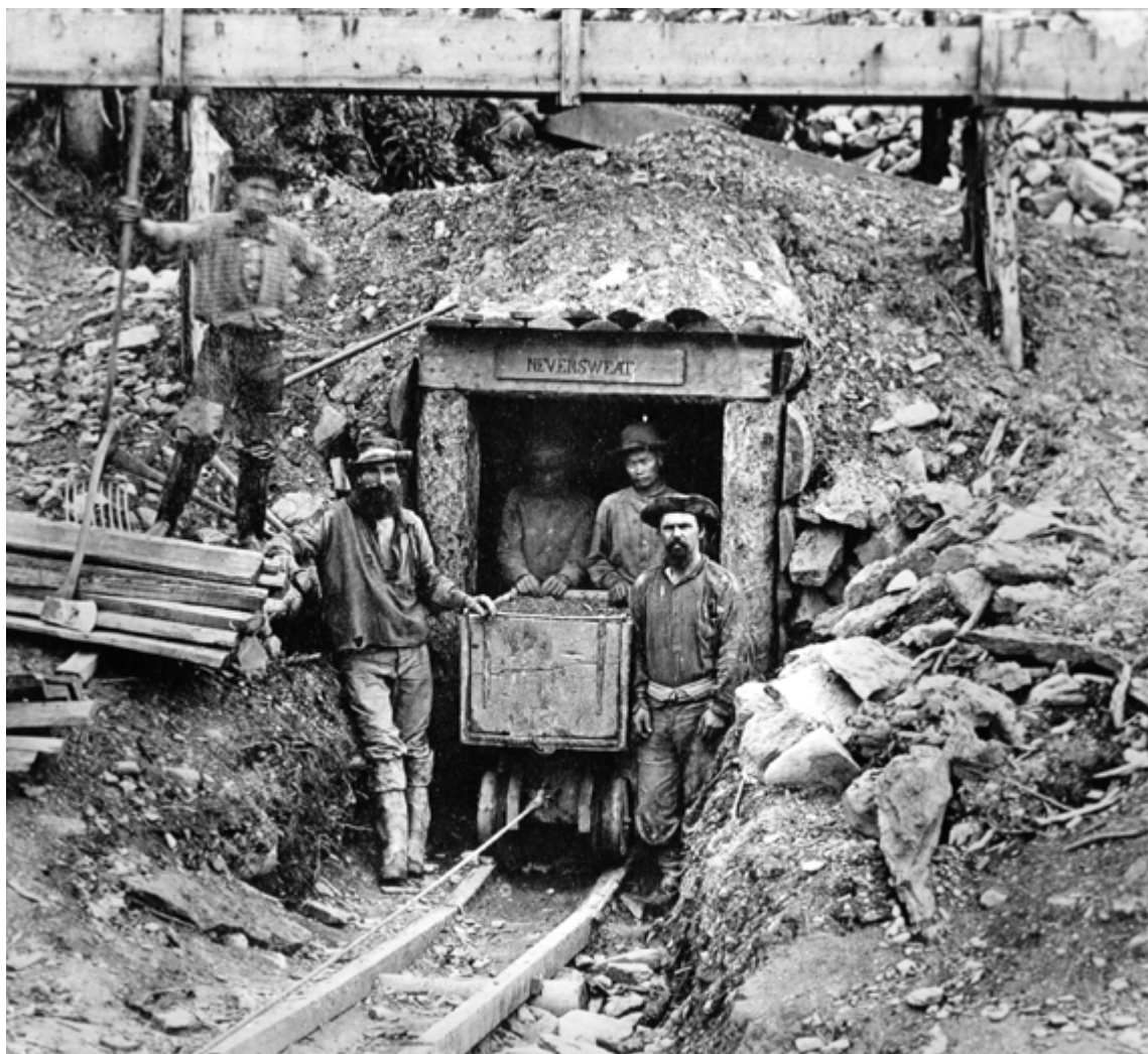
Entrée de mine sur une concession de la Neversweat Tunnel Co., Williams Creek. Photographie de Frederick Dally, vers 1868 (Archives de la Colombie-Britannique)