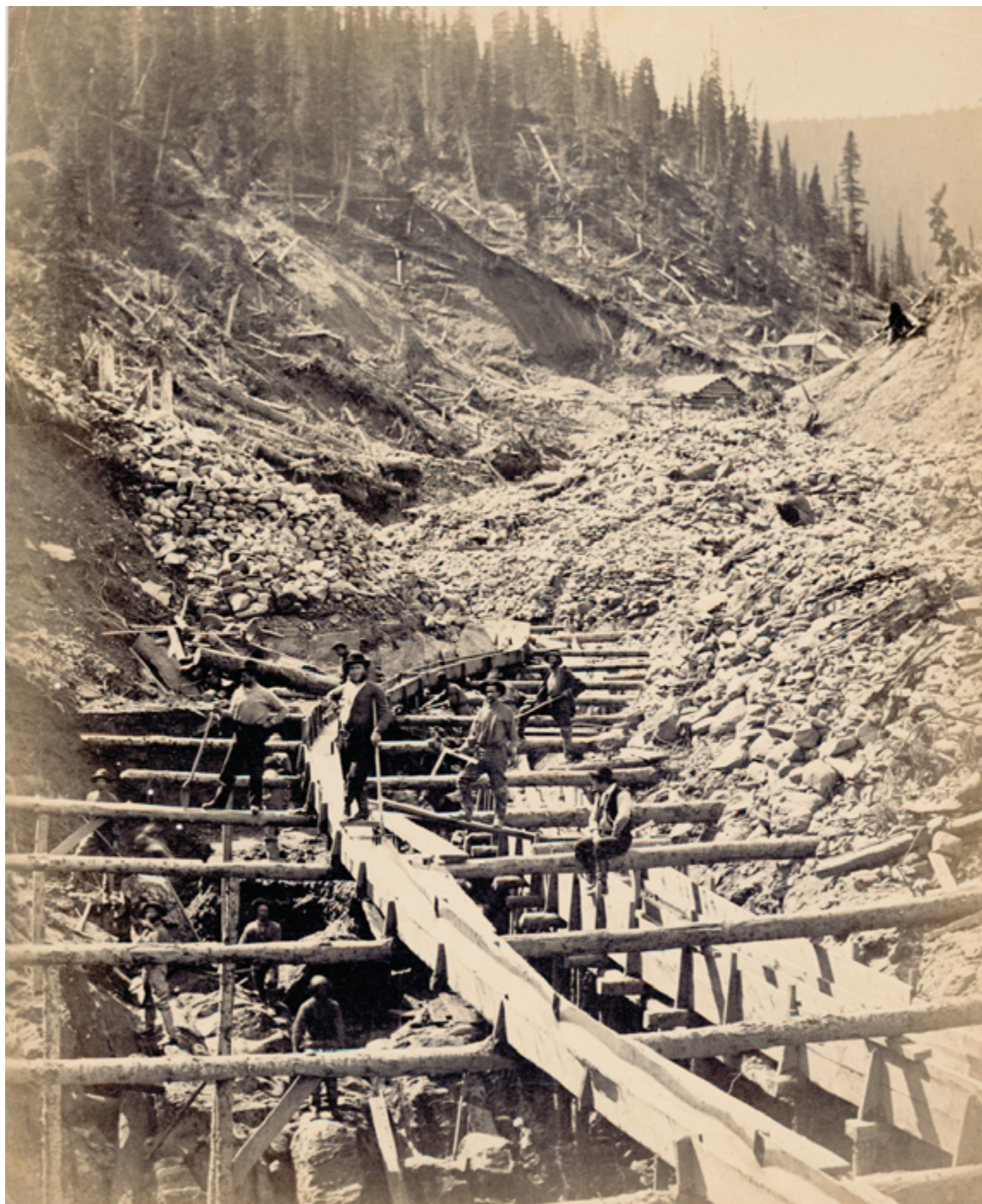
Hommes posant sur un canal d'amenée, Williams Creek. Photographie de Frederick Dally, vers 1868 (Archives de la Colombie-Britannique)