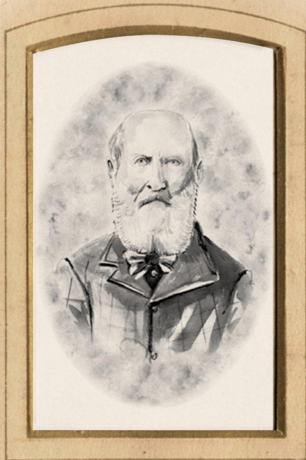
Image créée par Aimée van Drimmelen, artiste en résidence au Musée royal de la Colombie-Britannique